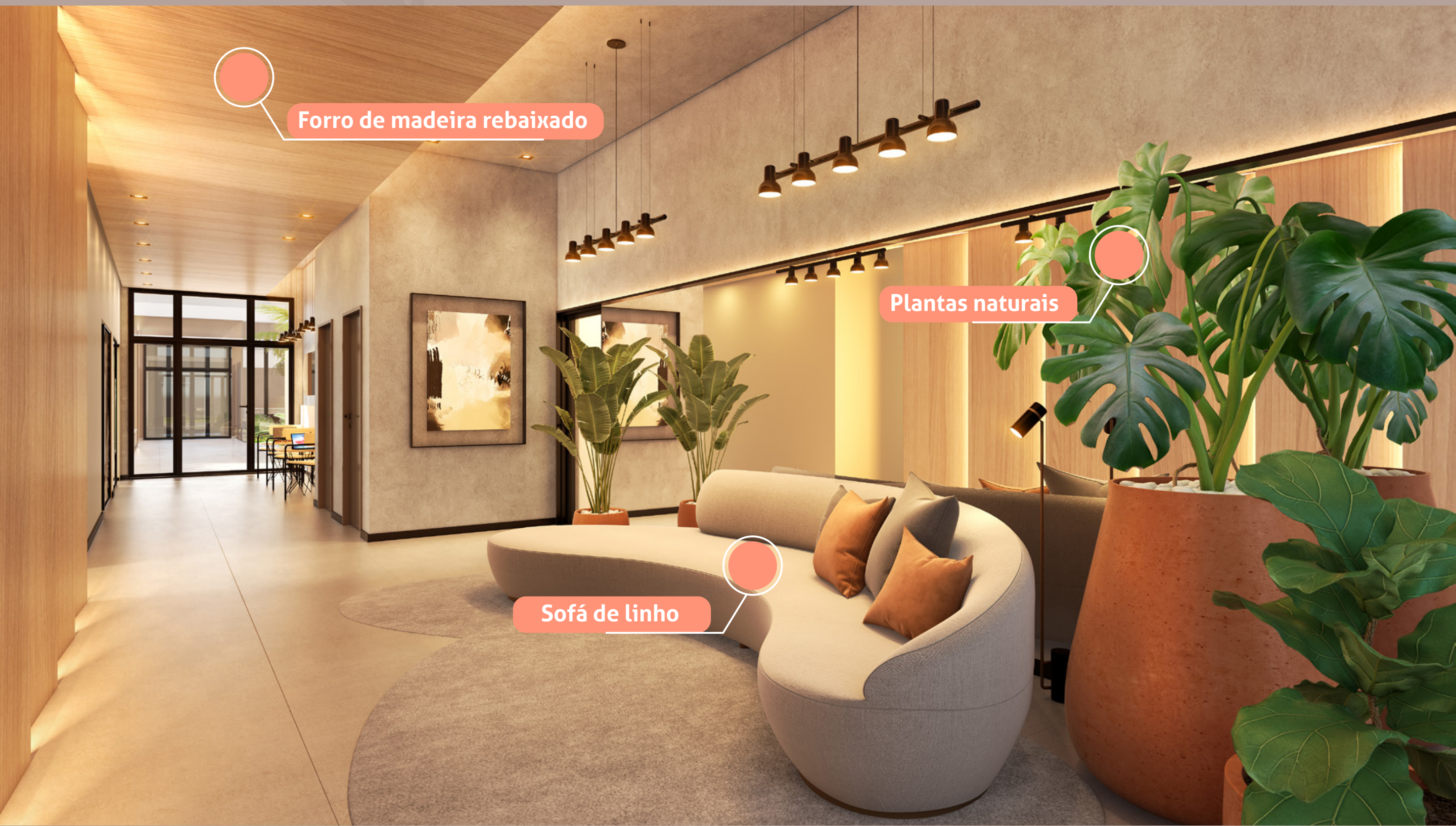
Forro de madeira rebaixado

Projetado com foco na saúde e no bem-estar, valorizando a relação entre a luz natural, a madeira, o ar e as plantas, proporcionando uma experiência completa.